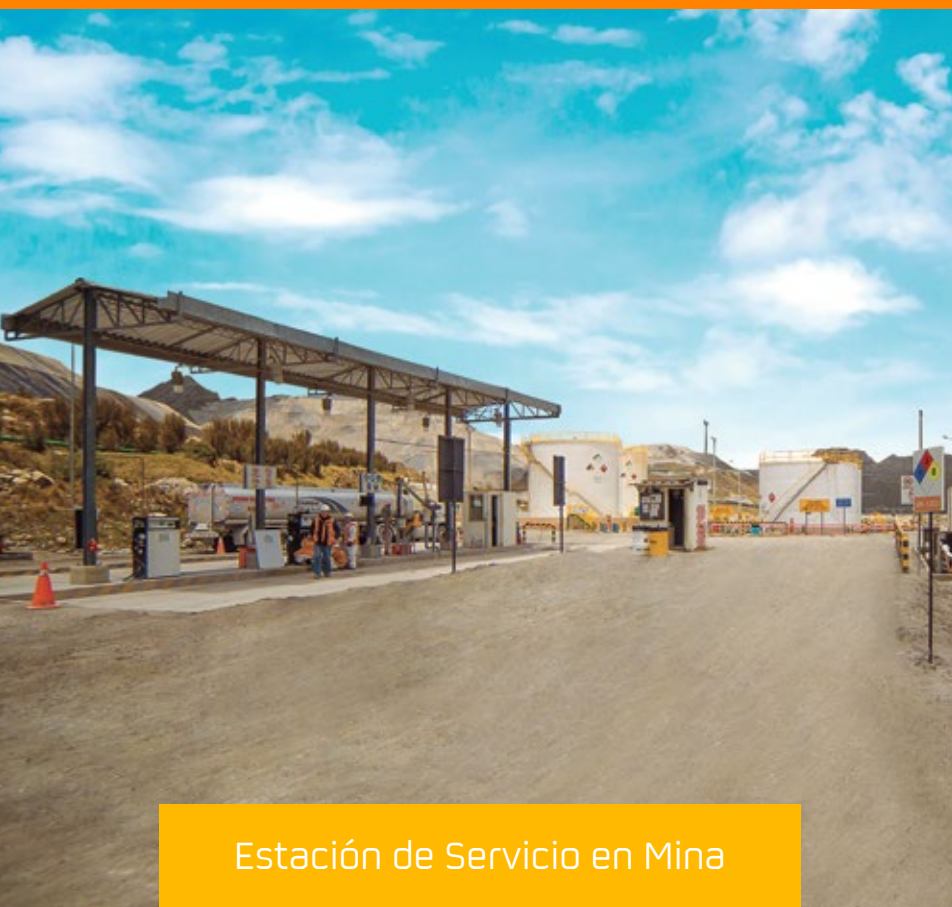
Estación de Servicio en Mina