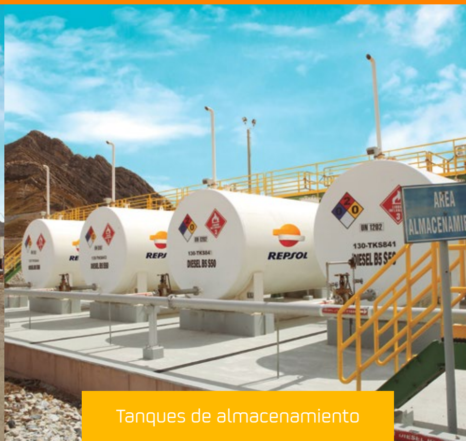
Tanques de almacenamiento