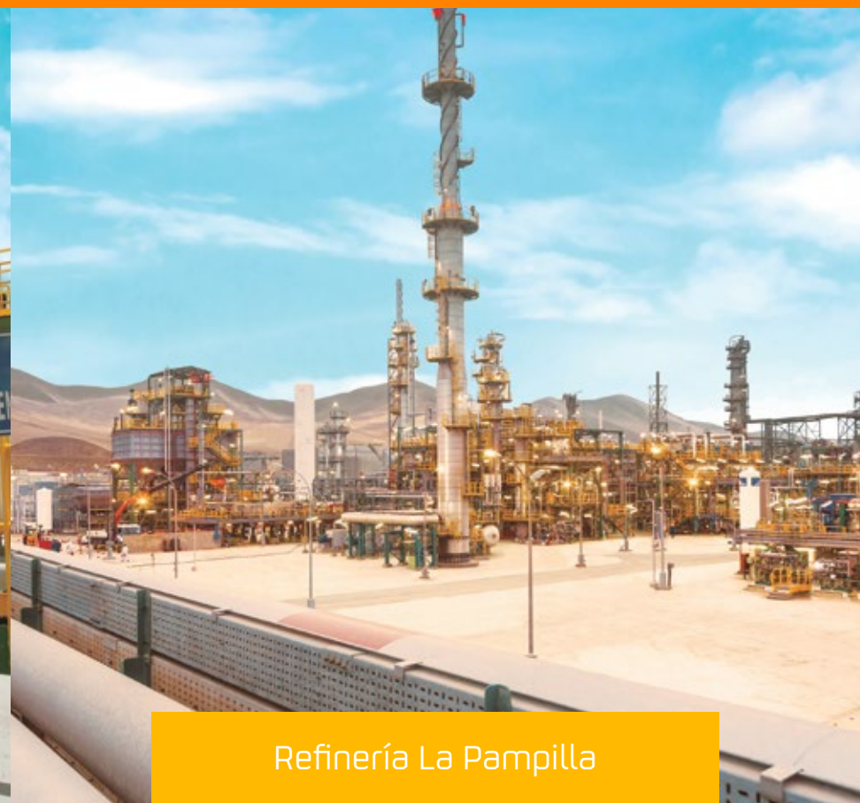
Refinería La Pampilla