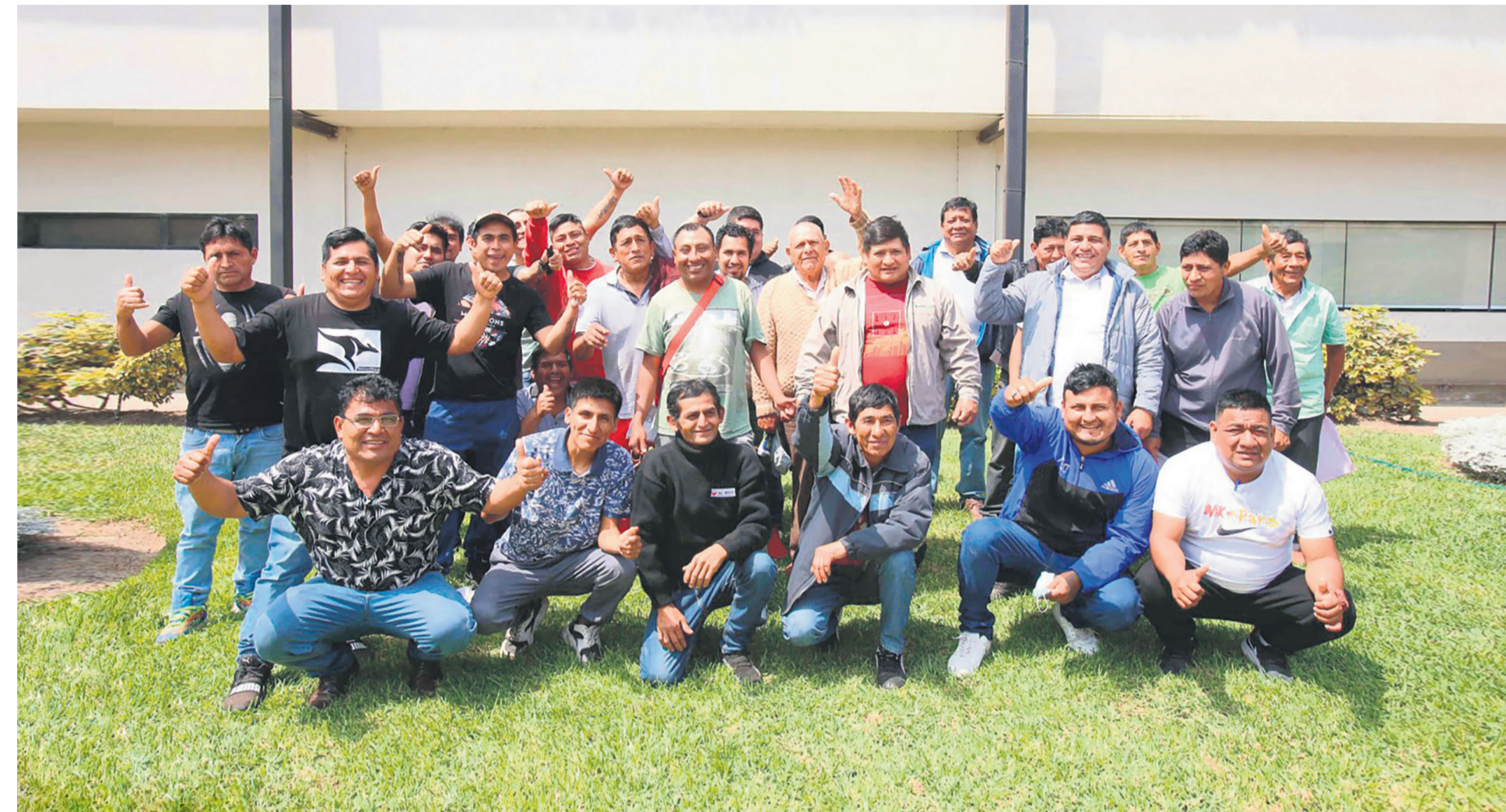
Repsol destinó más de 1.000 millones de soles para todos los trabajos de limpieza inmediata, remediación, monitoreo ambiental y compensación social.

Son más de 9.900 personas, entre comerciantes, pescadores artesanales, restauranteros, estibadores, entre otros.